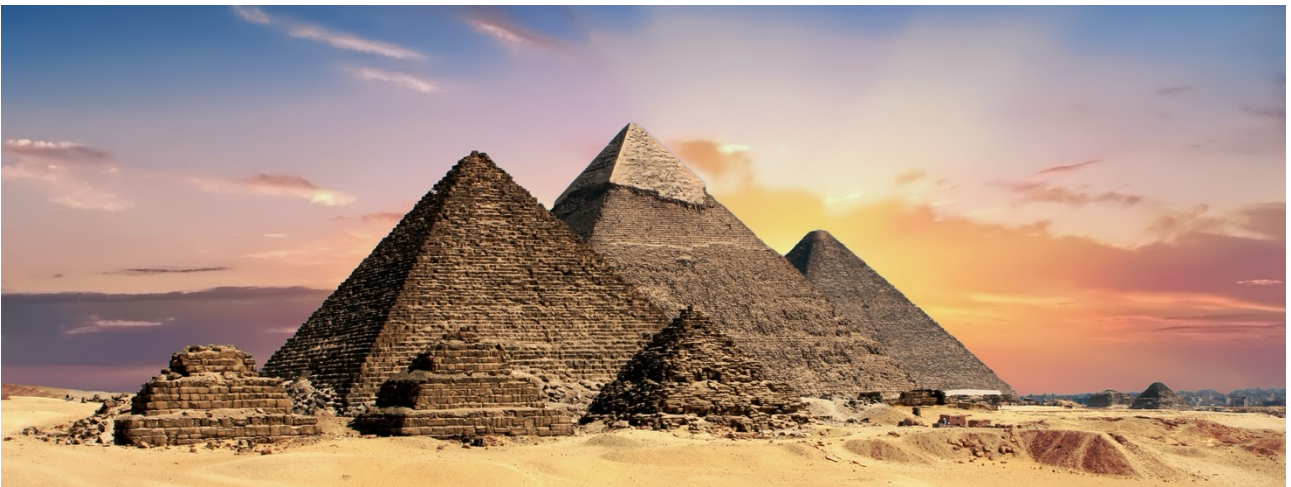
Pyramiderne i Giza, Cairo

Der er tjek ud efter morgenmadsen og I kører til lufthavnen for at flyve hjem til København med Egypt Air fra Cairo, ankomst i Kbh.