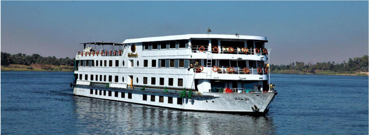
Langt krydstogt med MS Jaz Nile Monarch